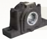
SAF-STEHLAGER Optimale Tragfähigkeit und erhöhte Lebensdauer