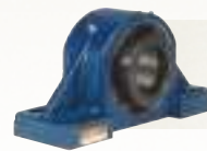
UNGETEILTE PENDELROLLENLAGER-GEHÄUSEEINHEITEN Zuverlässiger Schutz und hohe Leistung