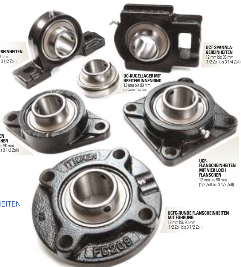
UCFC-RUNDE FLANSCH EINHEITEN MIT FÜHRUNG 12 mm bis 90 mm (1/2 Zoll bis 3 1/2 Zoll)