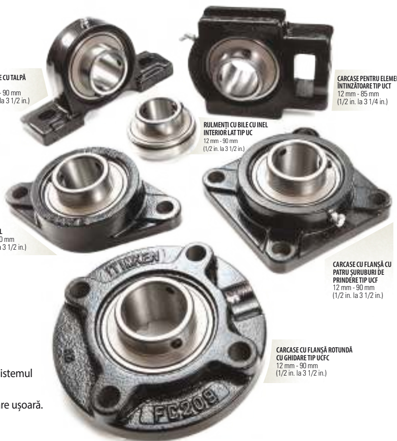
CARCASE CU FLANȘĂ ROTUNDĂ CU GHIDARE TIP UCFC 12 mm - 90 mm (1/2 in. la 3 1/2 in.)