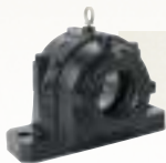
CARCUSE DIN DOUĂ PĂRȚI TIP SNT Soluție personalizabilă, eficiență a utilizării

Toate carcusele cu rulmenți sunt interschimbabile cu carcusele fabricate de alți producători.