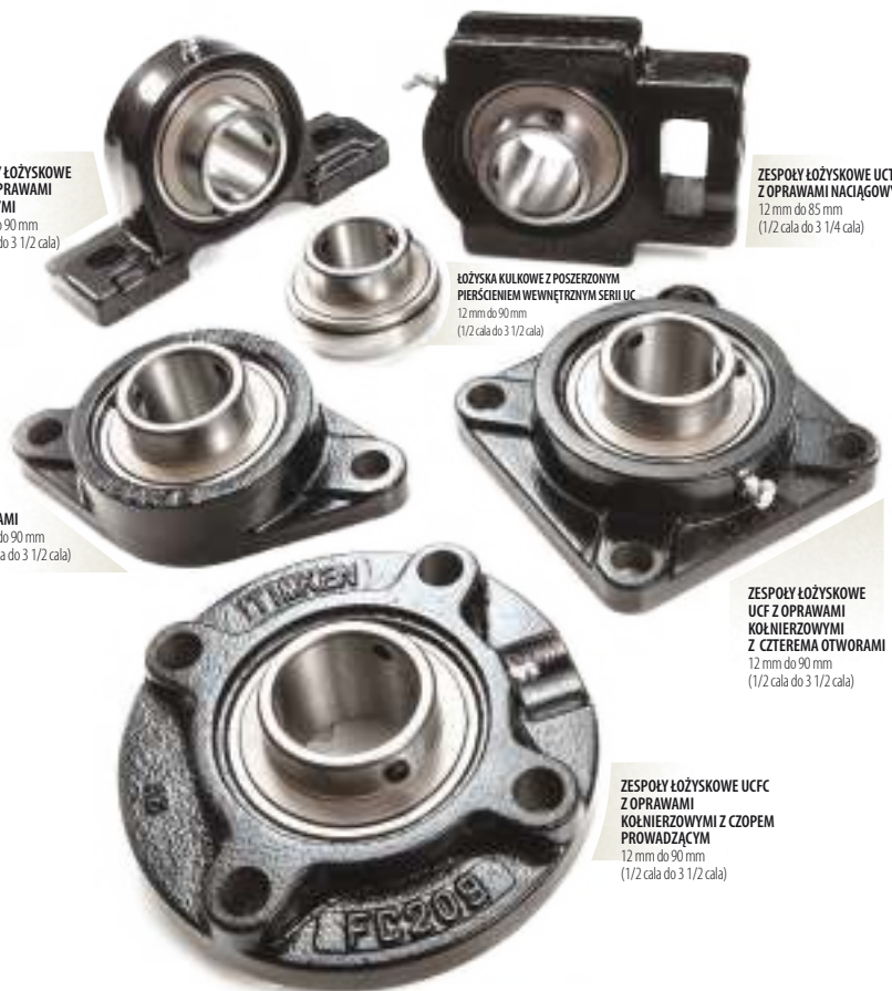
ZESPOŁY ŁOŻYSKOWE UCFC Z OPRAWAMI KOLNIERZOWYMI Z CZOPEM PROWADZĄCYM 12 mm do 90 mm (1/2 cala do 3 1/2 cala)