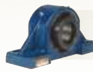
ZESPOŁY ŁOŻYSKOWE BARYŁKOWYCH W OPRAWIE NIEDZIELONEJ Ochrona w trudnych warunkach, wysoka wydajność