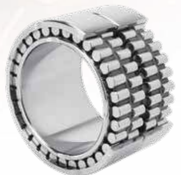
四列圆柱滚子轴承