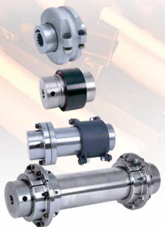
TIMKEN® Quick-Flex 联轴器