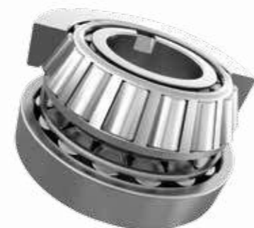
双列圆锥滚子轴承