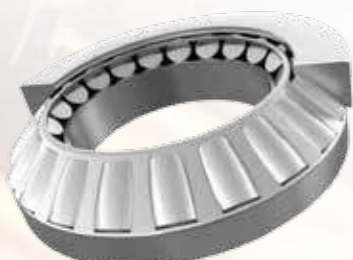
止推调心滚子轴承