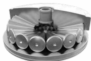
压下机构专用圆锥滚子轴承