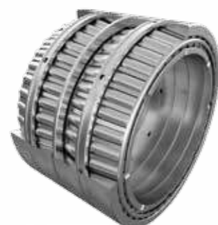
四列圆锥滚子轴承