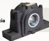
MANCAIS SAF Ótima capacidade de carga e vida útil estendida