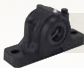
MANCAIS RETOS SNT Solução personalizável, eficiência no tempo de funcionamento

Todos os mancais são intercambiáveis com projetos padrão do setor.