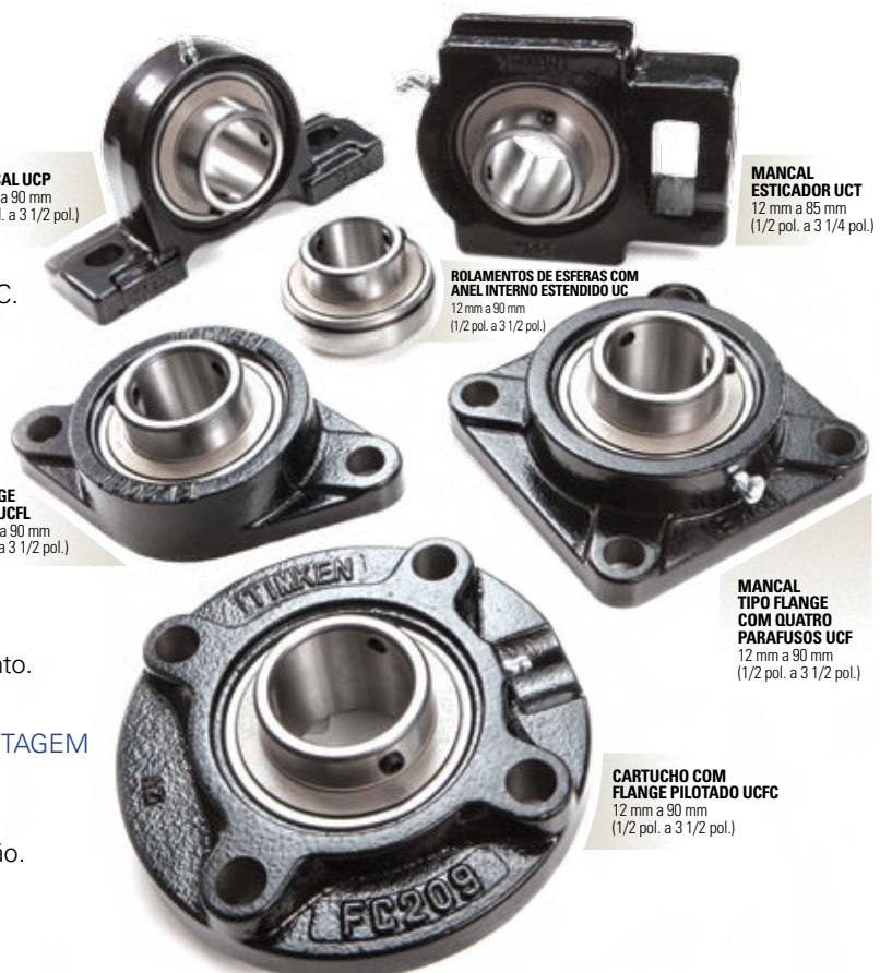
CARTUCHO COM FLANGE PILOTADO UCFC 12 mm a 90 mm (1/2 pol. a 3 1/2 pol.)