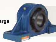
MANCAL MONOBLOCO COM ROLAMENTOS AUTOCOMPENSADORES DE ROLOS Proteção para serviço pesado, alto desempenho